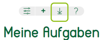
Abb. 3: Importieren auf dem Dashboard „Meine Aufgabe“

Klicken Sie unter „Meine Aufgaben“ auf den Pfeil. Es öffnet sich dieses Fenster. Wählen Sie, ob Sie die Aufgabe über einen Code oder über eine Datei importieren möchten und klicken Sie anschließend auf „Importieren“. Sie erhalten vom Programm eine Rückmeldung über den erfolgreichen Import.