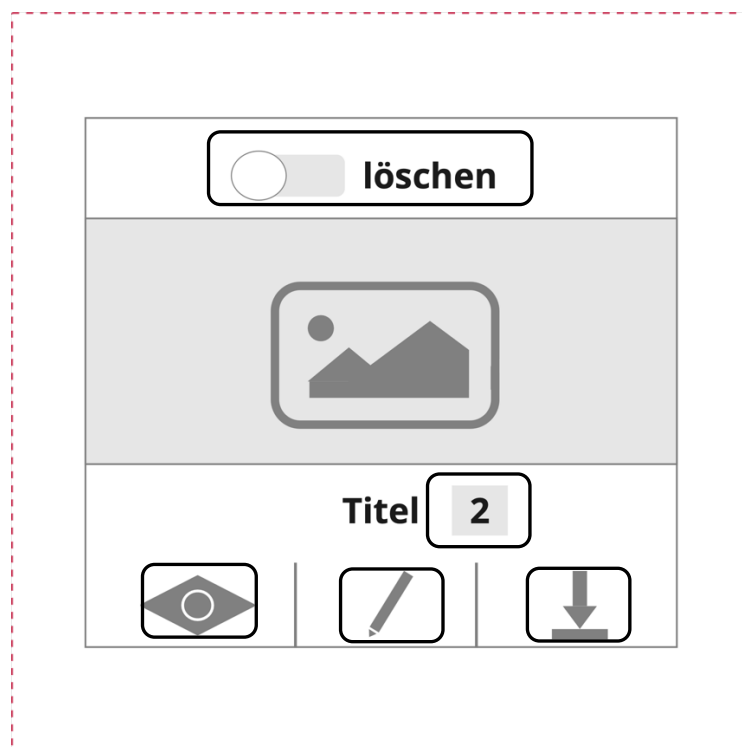
Abb. 2: Bearbeitungsmöglichkeiten der Titelbilder

Um Ihre Bilder in der Mediathek zu verwalten, können Sie z. B. einen Suchbegriff eingeben (und dies über die Lupe und Suchen bestätigen). Mit dem Auge-Icon erhalten Sie eine vergrößerte Ansicht, mit dem Stift-Icon das Bild umbenennen, eine Kopie des Bildes auf Ihre eigene Festplatte herunterladen oder es mithilfe des Schiebereglers oben (anklicken zum Aktivieren) löschen. Außerdem wird Ihnen angezeigt, wie häufig Sie das Bild in Ihren (Teil-)Aufgaben verwendet haben. Diese Information ist vor allem wichtig, wenn Sie ein Bild löschen wollen – denn es wird aus allen (Teil-)Aufgaben gelöscht! Damit dies nicht unbeabsichtigt passiert, werden Sie noch einmal ausdrücklich gefragt, ob Sie das Bild wirklich löschen wollen.