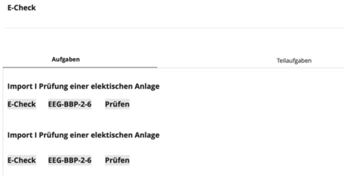
Abb. 5: Das Schlagwort E-Check wurde 2x verwendet