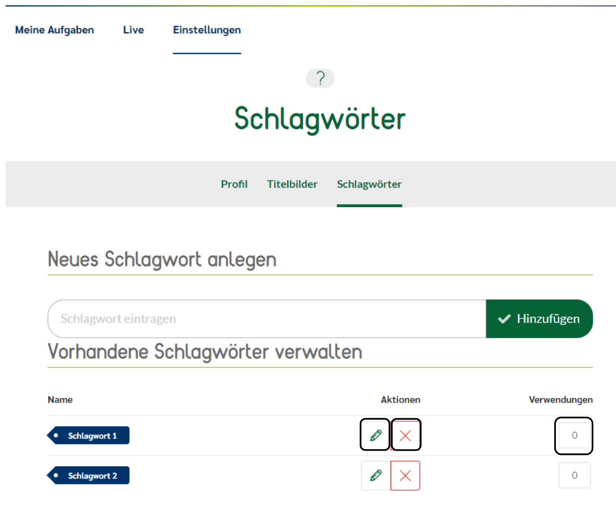
Abb. 3: Verwaltung der Schlagwörter

Genau hier (Dashboard ‚Meine Aufgaben‘ – Einstellungen – Schlagwörter) finden Sie auch die komfortabelste Möglichkeit, um Ihre Schlagwörter zu anzupassen oder zu löschen.