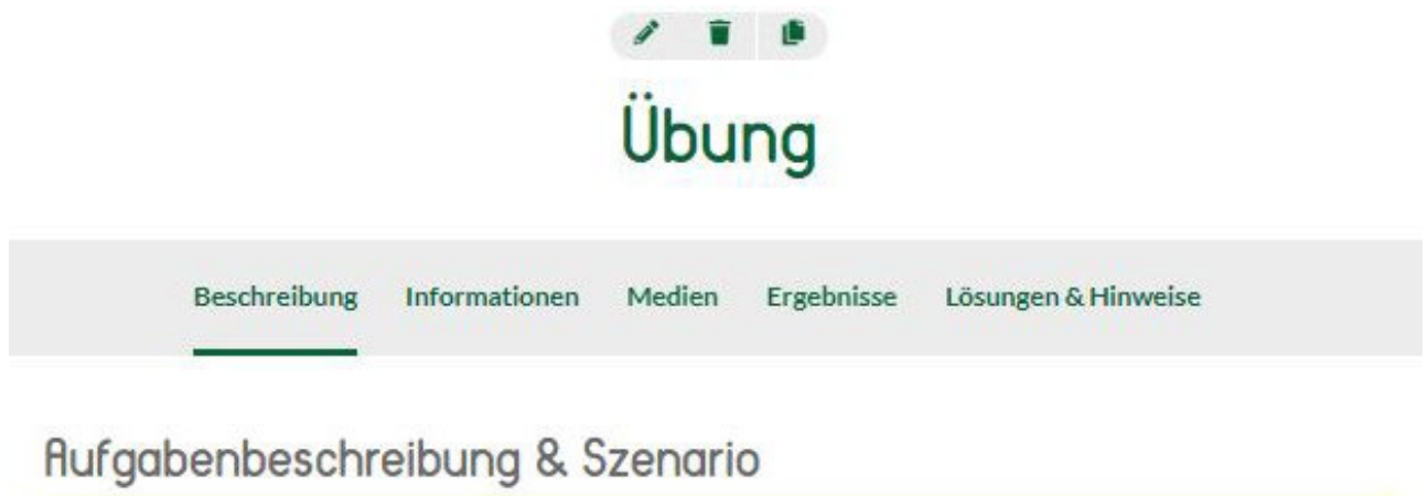
Abb. 1: Struktur des Aufgabentyps ‚Übung‘

Der Aufgabentyp Übung stellt eine in sich geschlossene Aufgabenstellung dar, die einen spezifischen Aspekt (Inhalt, Kompetenz) in Kürze aufgreift. Dieser Aufgabentyp ist geeignet, um abgeschlossene Themen und Aufgabenstellungen umzusetzen.