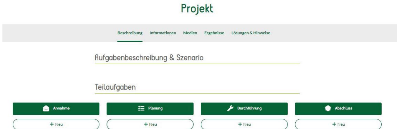
Abb. 3: Struktur des Aufgabentyps ‚Projekt‘

Der dritte Aufgabentyp Projekt stellt den komplexesten Typen dar und bildet projektförmiges Lernen an problemhaltigen Situationen der beruflichen Realität in mehreren Phasen ab. Mit diesem Aufgabentyp können besonders gut Lern- und Arbeitsaufgaben umgesetzt werden. Ein exemplarischer Kundenauftrag kann mithilfe dieses Aufgabentyps in Teilschritte untergliedert und damit vollständig von den Auszubildenden durchlaufen werden.