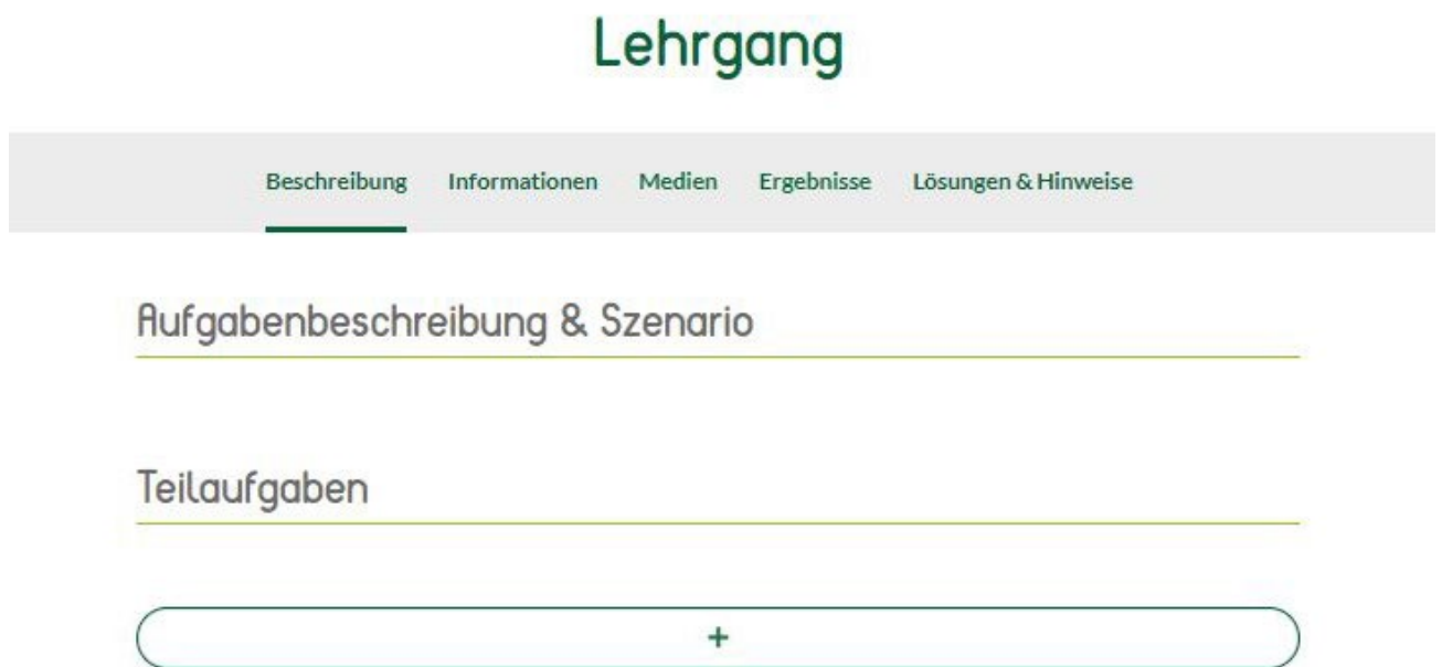
Abb. 2: Struktur des Aufgabentyps ‚Lehrgang‘

Der Aufgabentyp Lehrgang umfasst dagegen eine sequentielle Abfolge von sich aufeinander beziehenden Teilaufgaben, die in einer chronologischen Reihenfolge bearbeitet werden. Lehrgänge eignen sich besonders um ein Oberthema mit unterschiedlichen zusammenhängenden Aufgaben zu bearbeiten. Grundlage für die Lehrgänge können beispielsweise Teilaspekte eines exemplarischen Kundenauftrags darstellen.