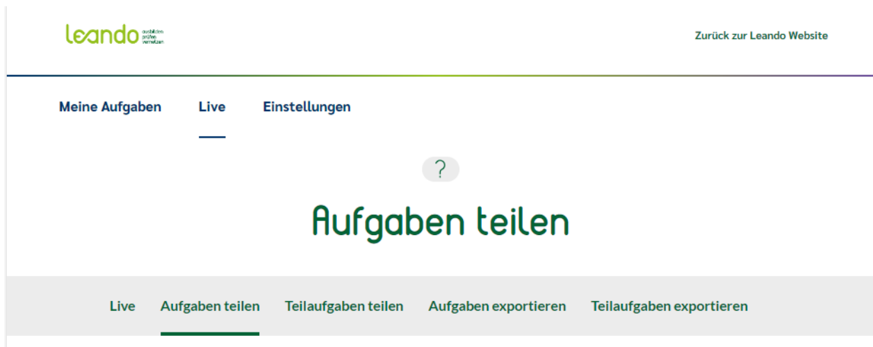
Abb. 2: Optionen zum Teilen und Bereitstellen von Aufgaben

Nachfolgend wird beschrieben, wie Sie Aufgaben ‚live‘-stellen können (Punkt 1).